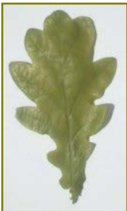
Het eikenblad, symbool voor Jeugd en Natuur

Welk dier is dit ?; begin bij 1 en eindig bij 43